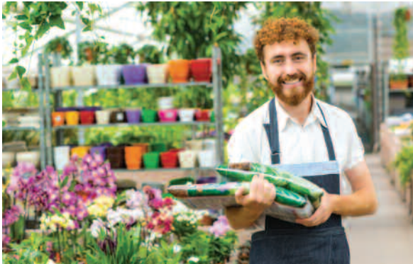
Conseiller de vente en jardinerie