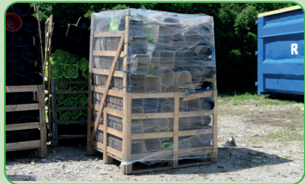
Pots cassés en box palette