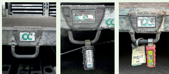
Roll sans cadenas, avec cadenas noir ou rouge mais avec plaque CC

Base avec plaque CC sans cadenas TAG5 (mais avec potentiellement d'autres cadenas)