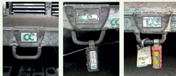
Roll sans cadenas, avec cadenas noir ou rouge mais avec plaque CC

Base avec plaque CC sans cadenas TAG5 (mais avec potentiellement d'autres cadenas)